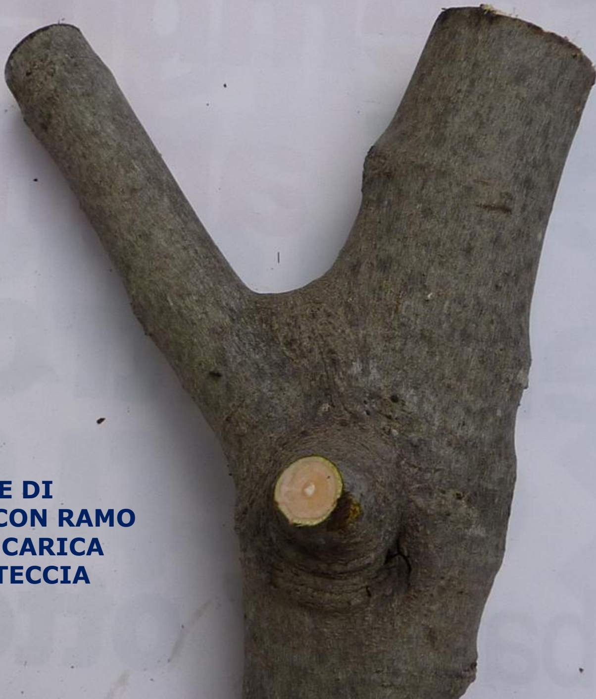
PORZIONE DI TRONCO CON RAMO DI FICUS CARICA CON CORTECCIA